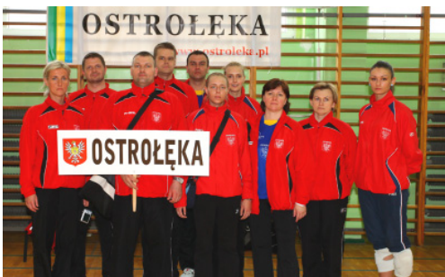
UM Ostrołęka - III miejsce w Klasyfikacji Medalowej OPEN oraz V miejsce w kat. OPEN w 2013 r.