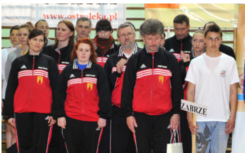
Zespół z UM Zabrze