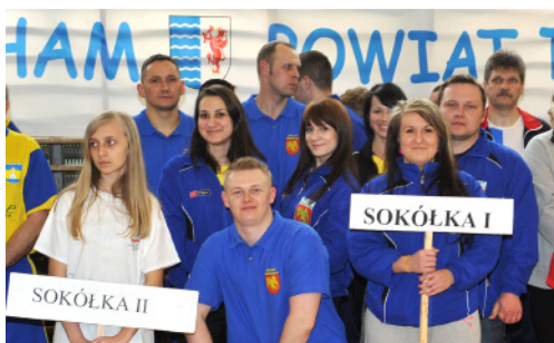
Zespoły ze Starostwa Powiatowego Sokółka I i Sokółka II