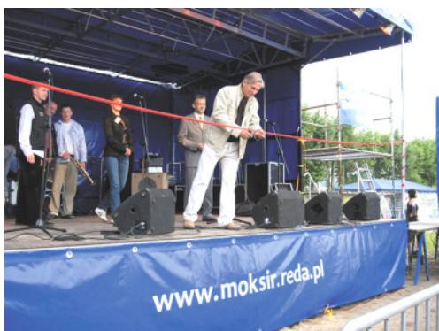
Scena mobilna MOSiR w Redzie