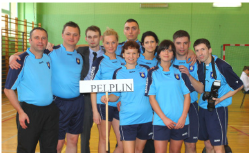
Zespół z UM i G Pelplin