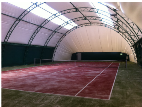
Hala tenisowa MOSiR w Redzie