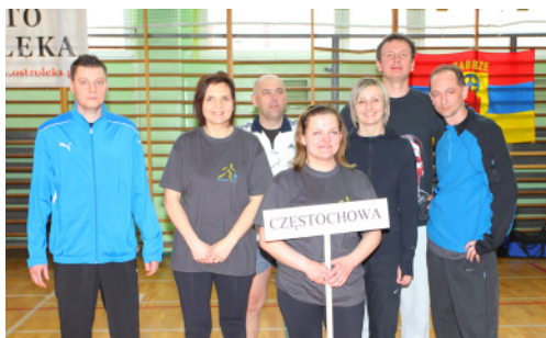
Zespół z UM Częstochowa