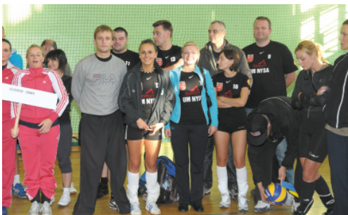
St. Pow. Nysa - XVII miejsce w kat. OPEN w MPPSwPS w 2013 r. oraz XV miejsce w Klasyfikacji Medalowej OPEN (zdj. z 2010 r.)