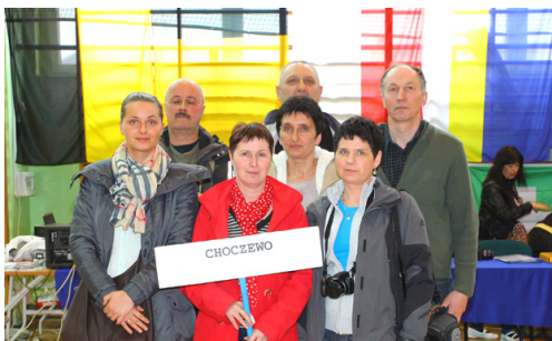
UG Choczewo - IV miejsce w kat. +45 w MPPSwPS w 2013 r. oraz V miejsce w Klasyfikacji Medalowej +45