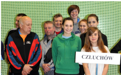
Zespół ze Starostwa Powiatowego Człuchów