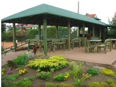
Nowa strefa biesiadna MOSiR w Redzie