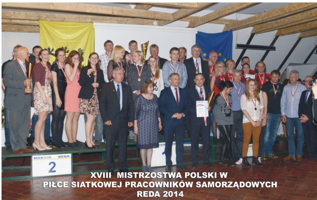
Mistrzowie +45 XVIII Mistrzostw Polski Pracowników Samorządowych w Piłce Siatkowej Reda 2014r. z organizatorami.