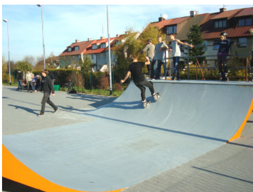
Skyte Park MOSiR w Redzie