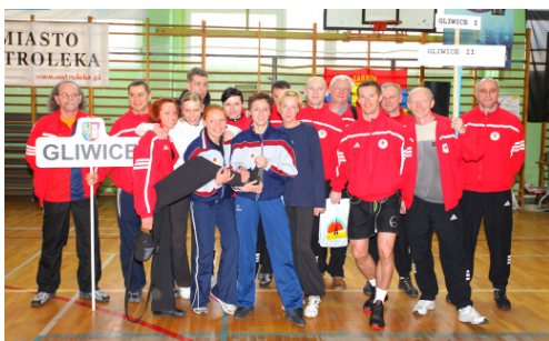
UM Gliwice II - II miejsce w kat. +45 w MPPSwPS w 2013 r. oraz IV miejsce w Klasyfikacji Medalowej +45