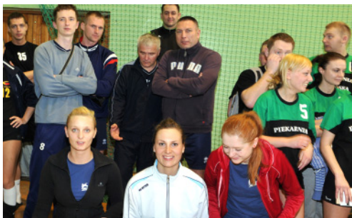
UM Milicz - I miejsce w Klasyfikacji Medalowej OPEN oraz II miejsce w kat. OPEN w 2013 r. (zdj. z 2010 r.)