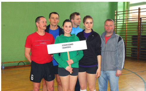
St. Pow. St. Gdański - I miejsce w kat. OPEN w MPPSwPS w 2013 r. oraz II miejsce w Klasyfikacji Medalowej OPEN