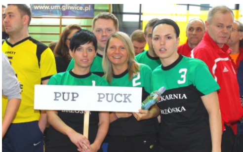
Zespół z PUP Puck