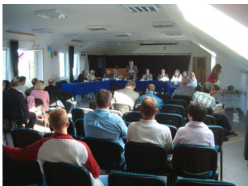
Sala konferencyjna MOSiR w Redzie