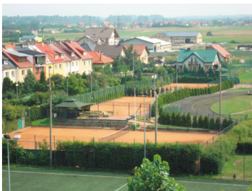
Korty tenisowe MOSiR w Redzie