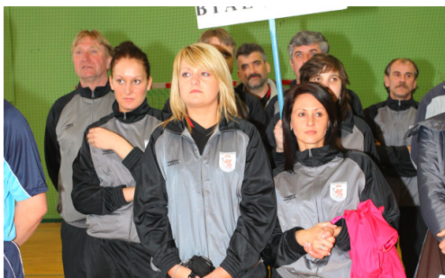
St. Pow. Białogard - VII miejsce w kat. +45 w MPPSwPS w 2013 r. oraz I miejsce w Klasyfikacji Medalowej +45