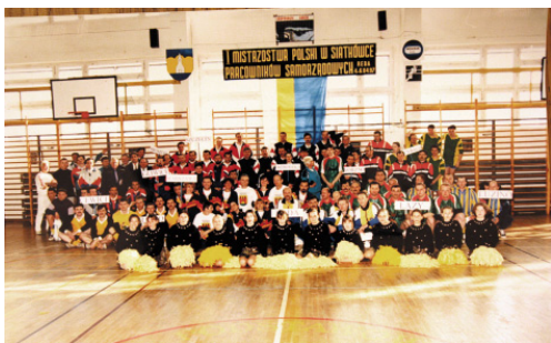
I MPPSwPS - tak rozpoczynaliśmy w 1997 roku