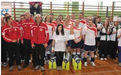
Zespoły z UM Gliwice, Urzędu Marszałkowskiego Woj. Matopolskiego