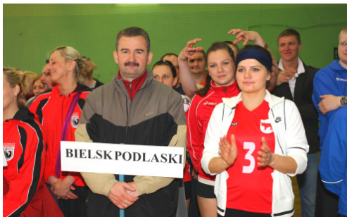
UM Bielsk Podlaski - VI miejsce w kat. OPEN w MPPSwPS w 2013 r. oraz XII miejsce w Klasyfikacji Medalowej OPEN