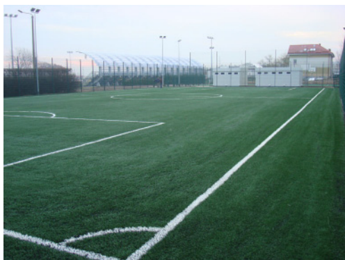
Boisko piłkarskie 30 x 60 - sztuczna trawa MOSiR w Redzie