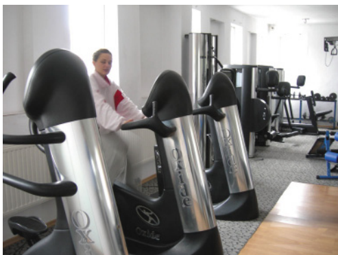
Siłownia MOSiR w Redzie