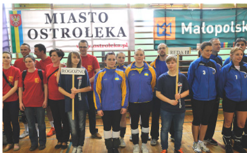
Zespół z UM Rogoźno i UM Reda II