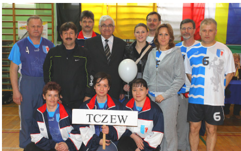
Zespół z UM Tczew