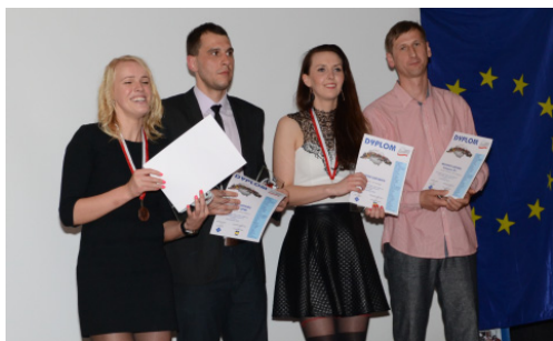
Miss i Mister Mistrzostw 2014 r. oraz najlepsza siatkarka i najlepszy siatkarz Mistrzostw 2014 r.