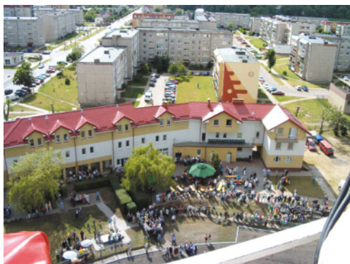
Budynek i zaplecze MOSiR w Redzie