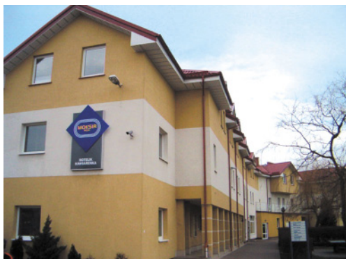
Hotel MOSiR w Redzie