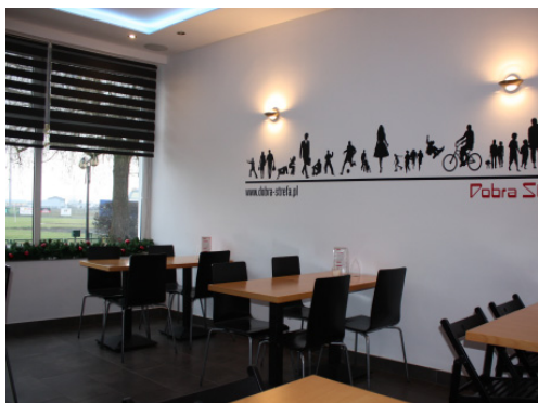
Restauracja "Dobra strefa" w budynku MOSiR w Redzie