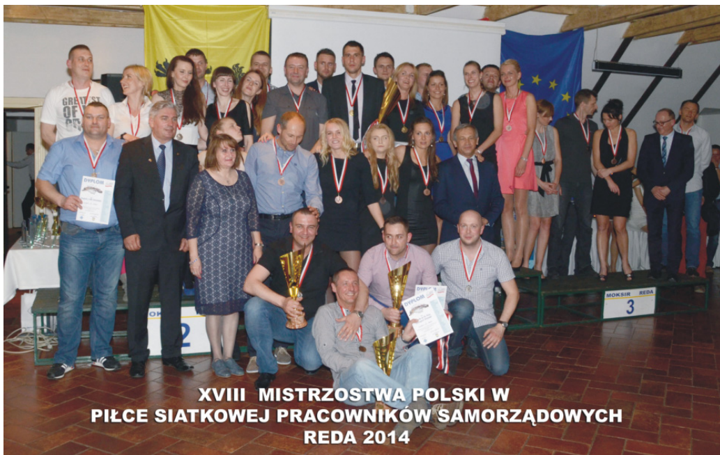
Mistrzowie OPEN XVIII Mistrzostw Polski Pracowników Samorządowych w Piłce Siatkowej Reda 2014r. z organizatorami.