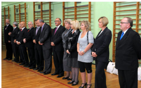
Członkowie Komitetu Honorowego i Zespołu Organizacyjnego XVI MPPSwPS